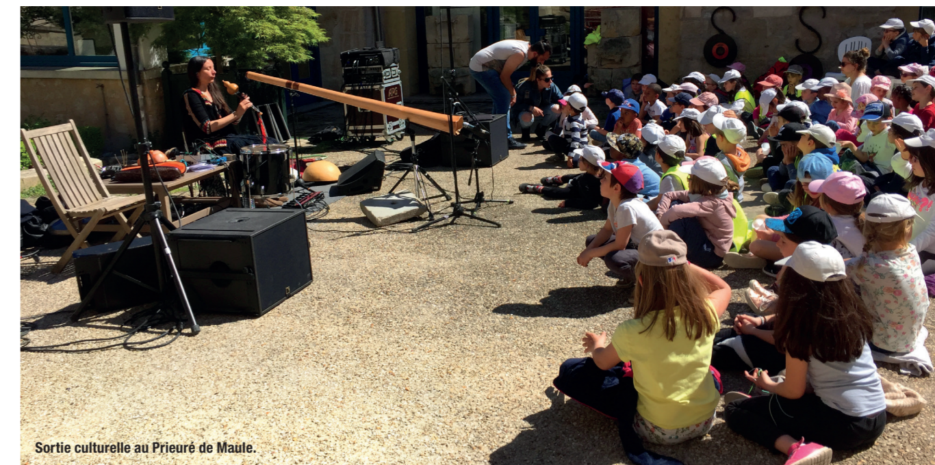
Sortie culturelle au Prieuré de Maule.